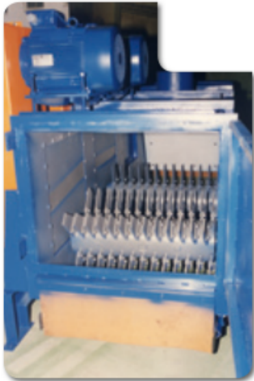
DK10, Altsand 100 t/h